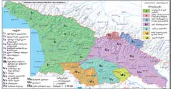
სის ელექტრონული ვერსიის შედგენა) განხორციელდა რუსთაველის ეროვნული სამეცნიერო ფონდის ფინანსური ხელშეწყობით (გრანტი GNSFST06/5-073). ეროვნული ატლასი სახელმწიფო აგრიბუციის ერთ-ერთი მნიშვნელოვანი ელემენტს და ქვეყნის სავიზიტო ბარ-

ათს წარმოადგენს. საქართველოს პირველი ატლასის გამოცემიდან (1964 წ.) 40 წელზე მეტი გაივლია. შეიცვალა პოლიტიკური, სოციალურ-ეკონომიკური და დემოგრაფიული ვითარება, დაიძაბა ეკოლოგიური სიტუაცია. აღინიშნული რეალიების გათვალისწინებით აუცილებელი გახდა ახალი ეროვნული ატლასის მომზადება და გამოცემა.