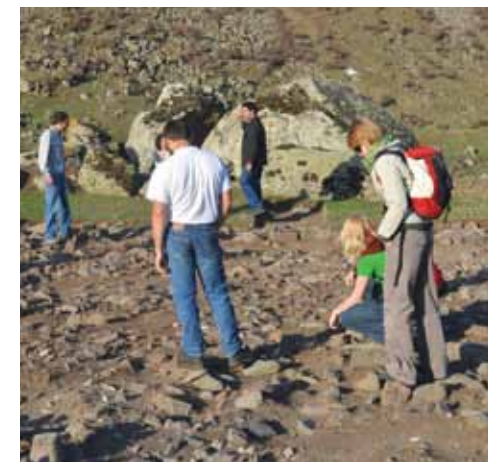
კონფერენციის მონაწილეები ბერთაყანაში