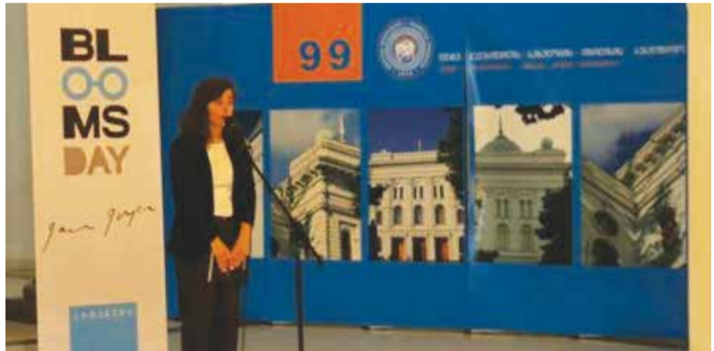
16 ივნისს თსუ-ში Bloomsday აღინიშნა. ღონისძიება, რომელიც Bloomsday-ს სახელითაა ცნობილი, ჯოისის რომანის „ულისის“ მთავარი გმირის – ლეოპოლდ ბლუმის სახელს უკავშირდება.

თსუ-ის ფუტკალის გუნდი საუნივერსიტეტო ჩემპიონატის ნახევარფინალშია. 19 ივნისს თსუ სტუდენტებმა კავკასიის საერთაშორისო უნივერსიტეტის გუნდთან ანგარიშით 5-0 დაამარცხეს და გათამაშების ცხრილის ლიდერის რანგში გაედიდნენ შემდეგ ეტაპზე