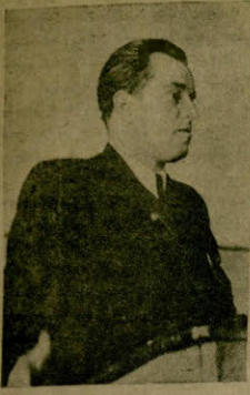
სურათი — კონფერენციის მსხვერპლს