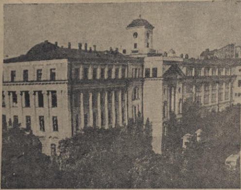
კვიციანი უკრაინის სსრ მეცნიერებათა აკადემია