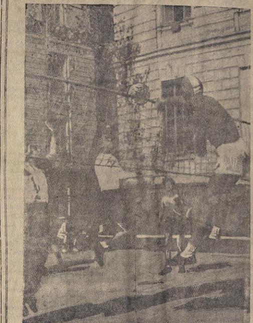
რამდენიმე დღეა რაც უნივერსიტეტის ფრენზუთის მოედანზე მიმდინარებს შეჯიბრება ფიზიკის ფაკულტეტის პირველზე ფრენზუთის შეჯიბრებაში მონაწილე ვითა გუაუხუი და ფილიპინო I კავშირში ოთხივე თამაში მოიგო და პირველი ადგილზე გაიდა I კურსის (რუსული სექტორი) ვითა გუი. II კავშირში ასევე გამარჯვებული გამოვიდა IV კურსის (რუსული სექტორი) ვითა გუი. ამდებულად მიმდინარეობს ქალთა გუნდების (4 გუნდი) შეხვედრები. ქალთა შორის II და IV კურსის გუნდებმა ჯერჯერობით მსოფლიო თითო დამარცხება განიცადეს და მათი შეხვედრა გაღმუჭვებს, თუ ვინ იქნება ფაკულტეტის ჩემპიონი. დღეს ჩატარებულ იქნება ფინალური შეხვედრები ვითა გუნდებს შორის. სტრატეგ I და IV კურსის სტუდენტ დრენზუთის უნივერსიტეტის მიხედვით.

დემოკრატიული ბანაკის სტუდენტთა მსოფლიო სტუდენტების მოწოდება რაობა, რომელიც უკვე დღის წიგნითი ამტკიცებს კავშირს კავშირს ქვეყნების სტუდენტობასთან. ისინი ერთიანი ძალით იბრძვიან მტკიცე მშვიდობისა და დემოკრატიისათვის.