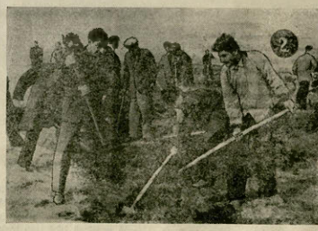
სსრკ-ის მშენებელი ჯარისკაცი წარმოადგენს წარმატებულ მოსახლეს...