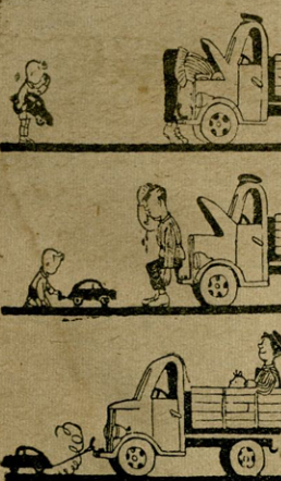
ქოლვაგილური დახარება ნახატი—ხურობა ამოღებულია პოლიტექნიკური განყოფიდან „სტიკატ მალისი“.