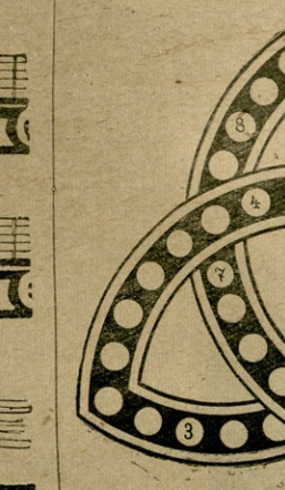
1. ზღის წამლკი მიქმდება. 2. მჭურავი ყინულის შიკა. 3. რუკაზე დედაიჭის ზედაპირის ტრანზიორი საშუალო ხაზითის ტემპერატურის მქონე პუნქტების შემარბთებელი პრეფი ხაზი...