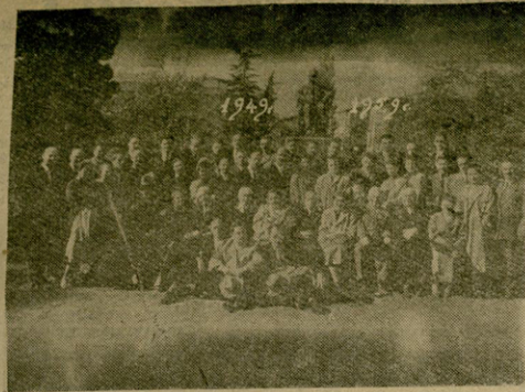
სურათში: შეხვედრის მონაწილენი უნივერსიტეტის ეზოში, ივანე ჯავახიშვილის ძეგლის ძველად.

დენტობა დაპითარეს, უნივერსიტეტს დაეშვიდებოდნენ და სამშობლოსათვის სასარგებლო და საქირო ადამიანებად იქცნენ. ახლა 16 იმთავანი შეინერვი მუშაობა, ბევრი მასწავლებლად მუშაობს, ბევრს სხვადასხვა პასუხისმგებელი თანამდებობა უწყობა და ყველანაირად ხალხის სიყვარული და პატივისცემა დაიმსახურა.