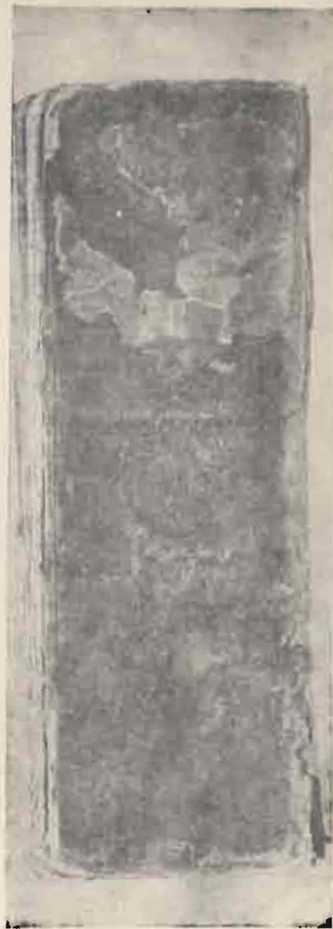
„აფრასიანის ეკლესიის ვიღა ვიგორის“ თარბელის სვეტის № 478 (საქართველოს სსრ-ის მუზეუმი)