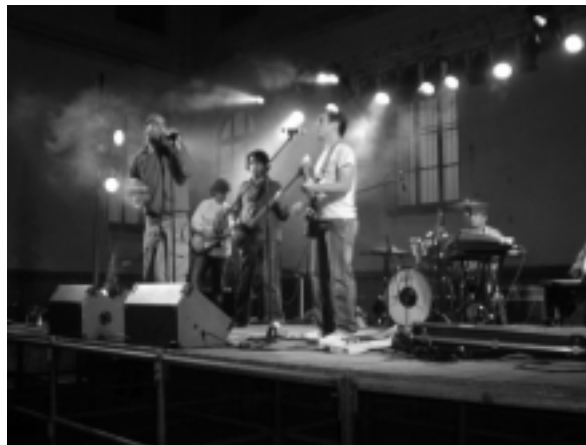
კონცერტი უნივერსიტეტის ეზოში - „საჩუქარი სტუდენტებს“.