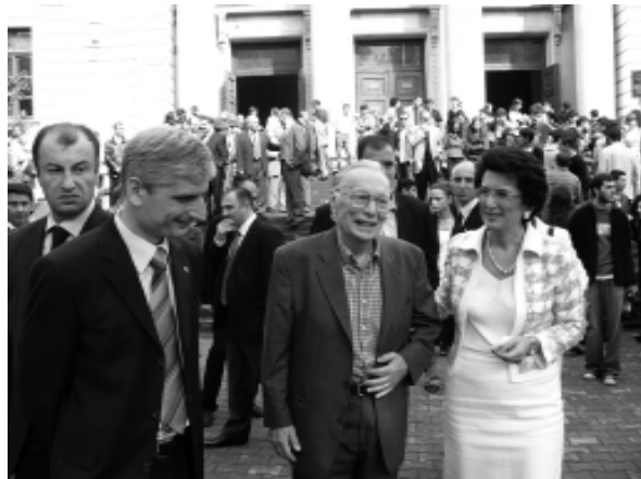
უნივერსიტეტის იურიდიულ ფაკულტეტზე სასემინარო ბიბლიოთეკის პრეზენტაციას პარლამენტის თავმჯდომარე ნინო ბურჯანაძე დაესწრო.