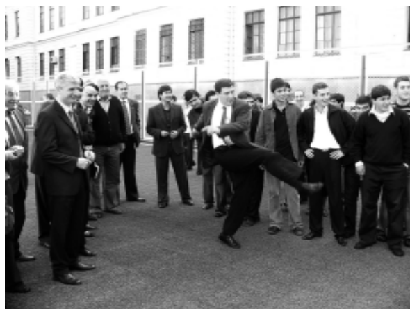
პირველი გოლი თბილისის უნივერსიტეტის ახლადგახსნილი სტადიონის კარში.