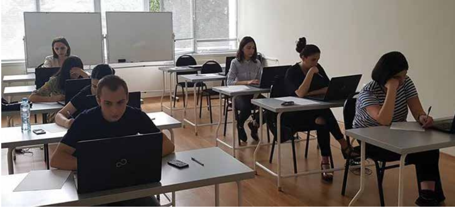
ბატონოვანა მ-2 გვ.

ივანე ჯავახიშვილის სახელობის თბილისის სახელმწიფო უნივერსიტეტში 2020 წლის ერთიანი ეროვნული გამოცდებისთვის მოსამზადებელ კურსზე ახალი ნაკადი მიიღო. 62 აბიტურენტი სრულფასოვნად მოემზადება ახალი საგანმეცნიერო სისტემით გათვალისწინებული პროგრამის მიხედვით 3 სავალდებულო საგანში – ქართული ენა და ლიტერატურა; უცხო ენა; მათემატიკა ან ისტორია (მომავალი სპეციალობის მიხედვით) და მე-4, არჩევითი საგანში.