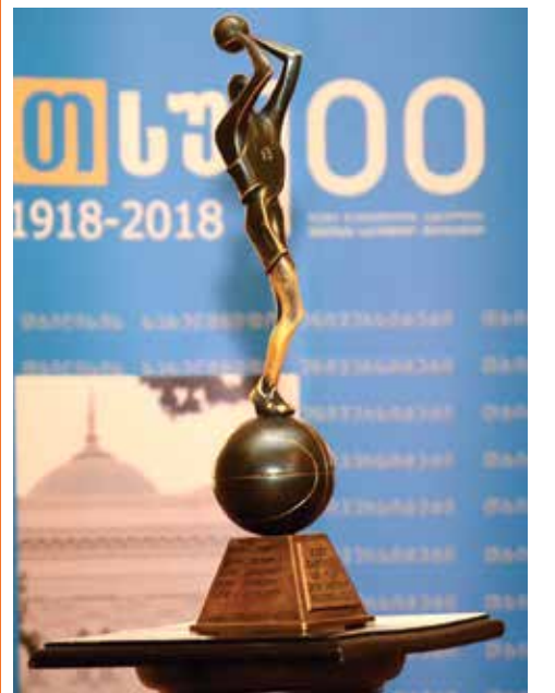
ბატონოვანა მ-4 გვ.

მემორანდუმის ფარგლებში მხარეები ქვეყანაში განათლების სფეროში ინოვაციური პროექტების განხორციელებას შეუწყობენ ხელს, ასევე საჯარო ლექციების, გრენინგების, მასგერკლასების, სხვადასხვა გნაის კონკურსების ორგანიზებაში მზადყოფნას გამოხატავენ. „ლინგვინგო“ ხელს შეუწყობს უნივერსიტეტის სტუდენტების ჩართვას სხვადასხვა ღონისძიებაში, ევროპული ენების პოპულარიზაციის მიზნით, საქართველოში აკრედიტებული უცხოური ორგანიზაციების და ღონისძიების ჩართულობას, ინოვაციებისა და ტექნოლოგიების მიმართ