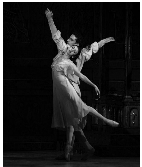
ნომეო და ჯულიეტა